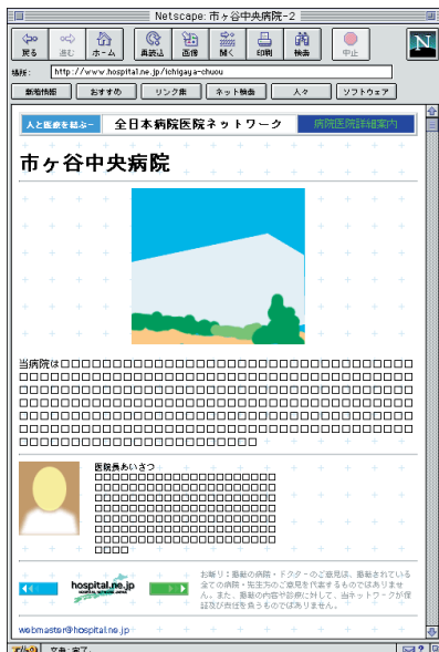
第2画面デザイン見本